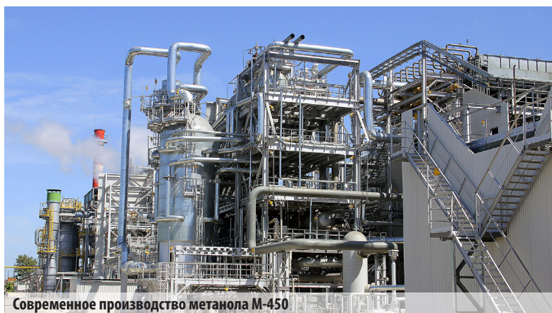
Современное производство метанола М-450

водства капролактама и аммиака. А в мае 2014-го был заложен первый камень в основание новой индустриальной площадки, также создаваемой при участии «Хальдора Топсе». Производство, которое планируют запустить в 2017 г., будет выдавать ежегодно 450 тыс. т метанола и 135 тыс. т аммиака. Это высокоавтоматизированная площадка, сочетающая в себе способность обеспечить заявленное количество продукции с высоким уровнем промышленной безопасности и экологичности. Данные принципы «Щекиноазот» считает одними из ключевых в своей стратегии.