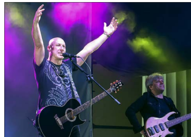
Празднование Дня химика на центральной площади Щёкино завершилось под всенародно любимые хиты обладателя премии «Золотой граммофон», «Песня года» и «Шансон года» Дениса МАЙДАНОВА.