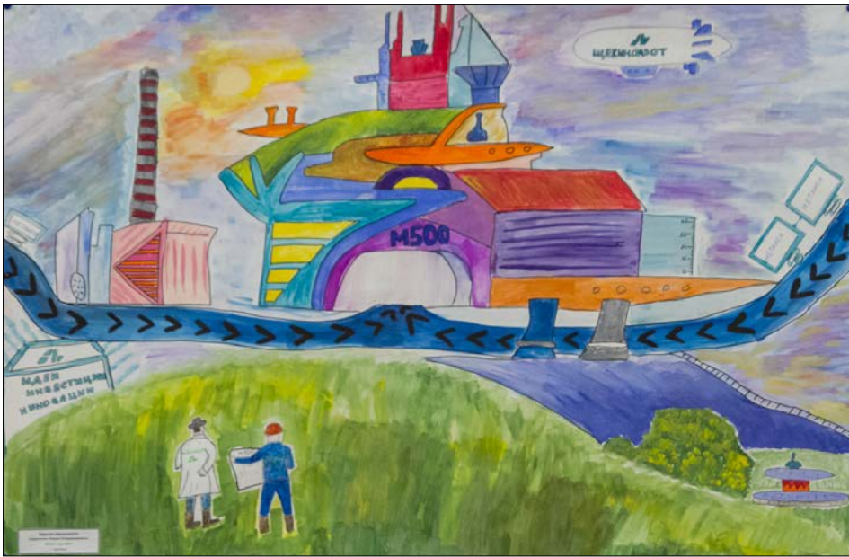
Дети щекинских химиков рисуют будущее.

прибылям, а вопрос дальнейшего развития предприятия и благополучия каждого члена коллектива. Это и бесплатные спортивные секции для детишек, и летний отдых в пансионате «Шахтер» на Оке, и семейные отпуска в Анапе за счет «Щекиноазота», это неуклонно растущая заработная плата и перспектива достойного трудоустройства детей, а потом и внуков. Компания всегда славилась своими династиями, по триста-четыре года лет в сумме работающими на 63-летнем заводе. И, судя по обилию замыслов, складывающихся в стройную стратегию развития, этим династиям еще продолжаться и продолжаться.