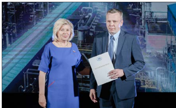
Химиков поздравила депутат Государственной Думы РФ Наталия ПИЛЮС.

Это не просто высокопроизводительные рабочие места, дополнительные налоговые отчисления, новые социальные проекты. Это символический рубеж, который многое значит для предприятия, и не только для него. Установка по выпуску аммиака и метанола – уникальная технология, до сих пор не применявшаяся ни в России, ни в Европе. Диметиловый эфир парфюмерного качества предприятия