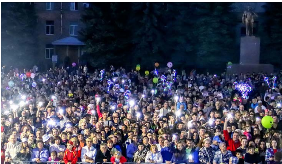
В Щекино День химика - праздник особенно любимый.

Наталья ЗЕЛИНСКА, Фото Александра КОЛЕСНИКА, Андрея ТЕТЕРИНА и пресс-службы правительства Тульской области.