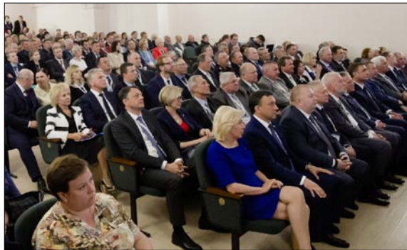
Почетные гости праздника.