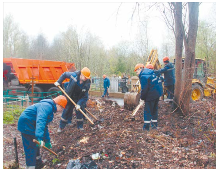
Два дня сотрудники компании «Щекиноазот» убирали мусор на кладбище в Кочаках.

ВАЖНОЙ частью проведенных в Кочаках работ стала укладка асфальта. Подрядчик