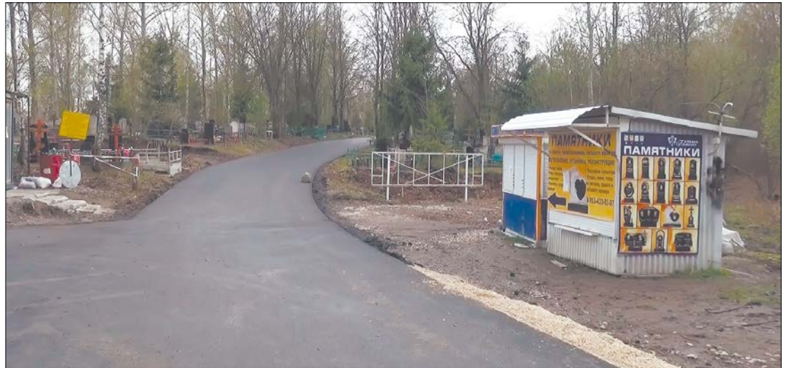
Кладбище в Кочаках преобразилось: только на ремонт дорог направлено 5 миллионов рублей.

По инициативе и на средства компании «Щекиноазот» проведены масштабные работы по благоустройству кладбища в Кочаках.