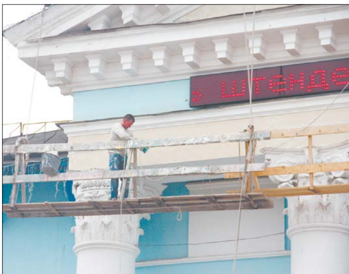
Фасад ЦДТ обновят.