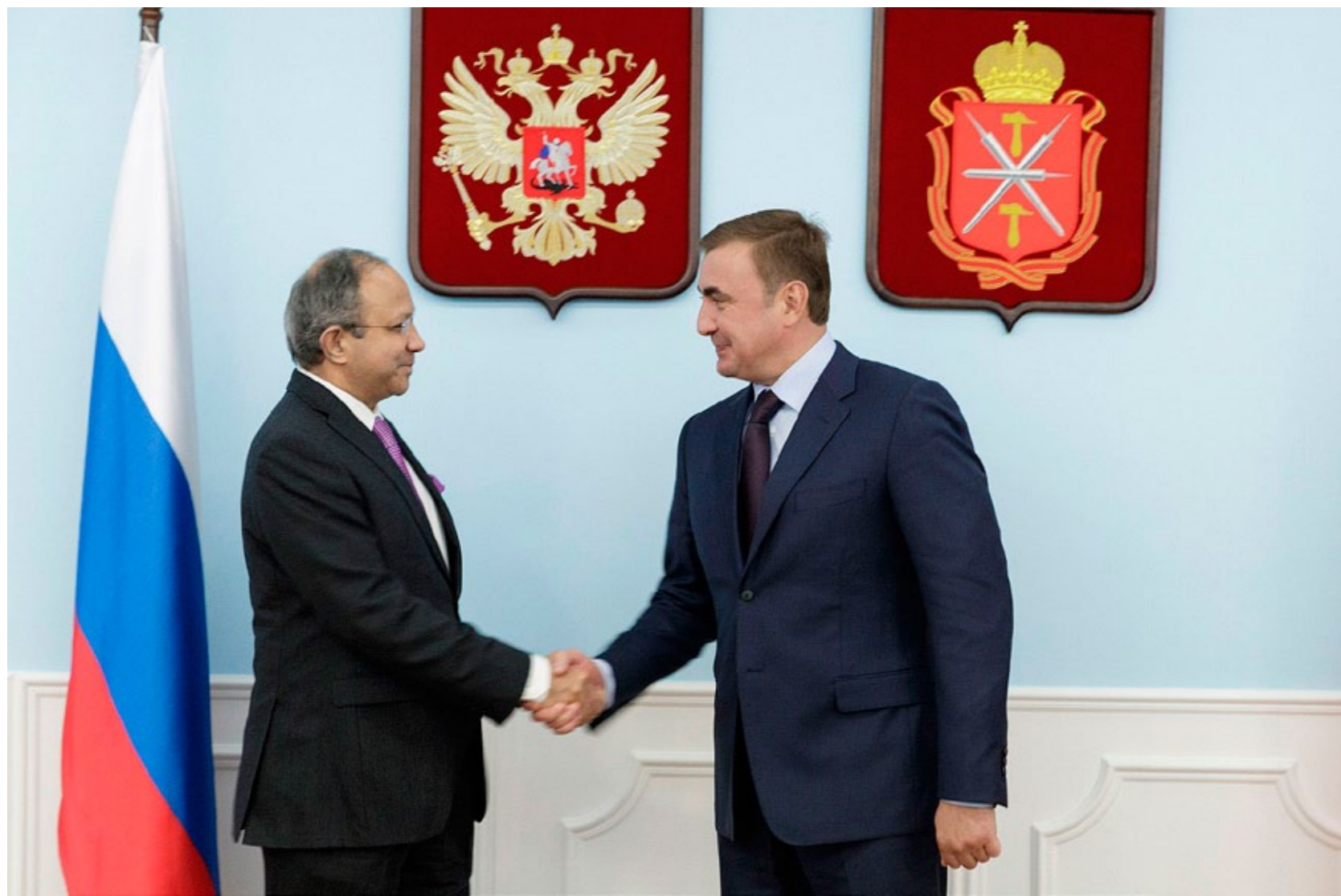
Алексей Дюмин в общении с послом отметил, что каждый крупный индийский инвестор может рассчитывать на поддержку губернатора