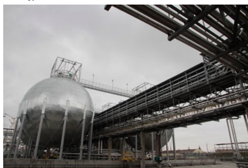
Масштабы предприятия и его деятельность произвели неизгладимое впечатление на гостей из Индии