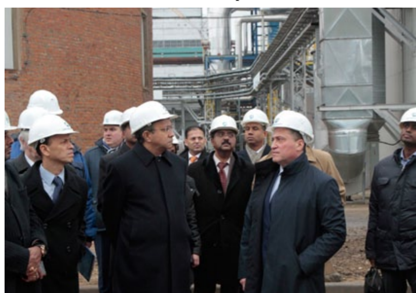
Индийская делегация осмотрела производственные площадки «Щекиноазота»