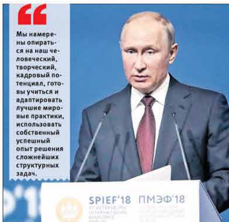
Владимир Путин поздравил Тульскую область и другие регионы, вошедшие в первую пятерку национального рейтинга АСИ по состоянию инвестиционного климата.

«Тульский завод алюминия» станет новым резидентом особой экономической зоны «Узловая». По заявлению инвестора, завод построят в следующем году, он