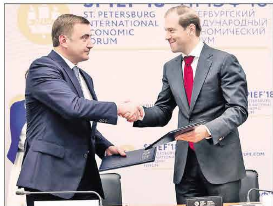
Губернатор Тульской области Алексей Дюмин и министр промышленности и торговли РФ Денис Мантуров на подписании соглашений по специальным инвестиционным контрактам.

– Главные дивиденды нашей компании – продолжение стратегической программы развития, начатой в 2005 году. За 13 лет мы реализовали 16 проектов. 2018 год для нас очень ответственный. К сентябрю мы должны запустить четыре новых проекта, в том числе проект по метанолу и аммиаку, соглашение по кото-