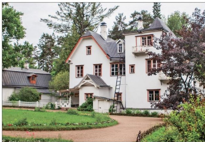
Творил Василий Поленов в мастерской, которую и тогда, и сейчас все называют Аббатство – маленький католический храм.

Кажется, что усадьба оберегается свыше. Ее обошло стороной мародерство крестьян после революции, усадьбу не конфисковали, она практически без потерь пережила войны. И это во многом благода-