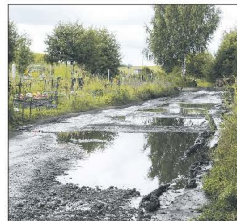
На кладбище «Кресты» около четырех километров дорог. И все были вот в таком жутком состоянии.

Заметим, что дороги на кладбище «Кресты» сейчас назвать дорогами нельзя. Так, направления. На автомобиле проехать еще можно, но только очень осторожно и с уверенностью, что машину потом срочно нужно будет мыть. А вот пешеходам без резиновых сапог там делать нечего, иначе можно увязнуть в грязной жиже — прошедший накануне дождь превратил дороги в непроходимые «болота». Ну а о пожилых людях и говорить не стоит — им по таким дорогам пробраться к могилам родных практически невозможно.