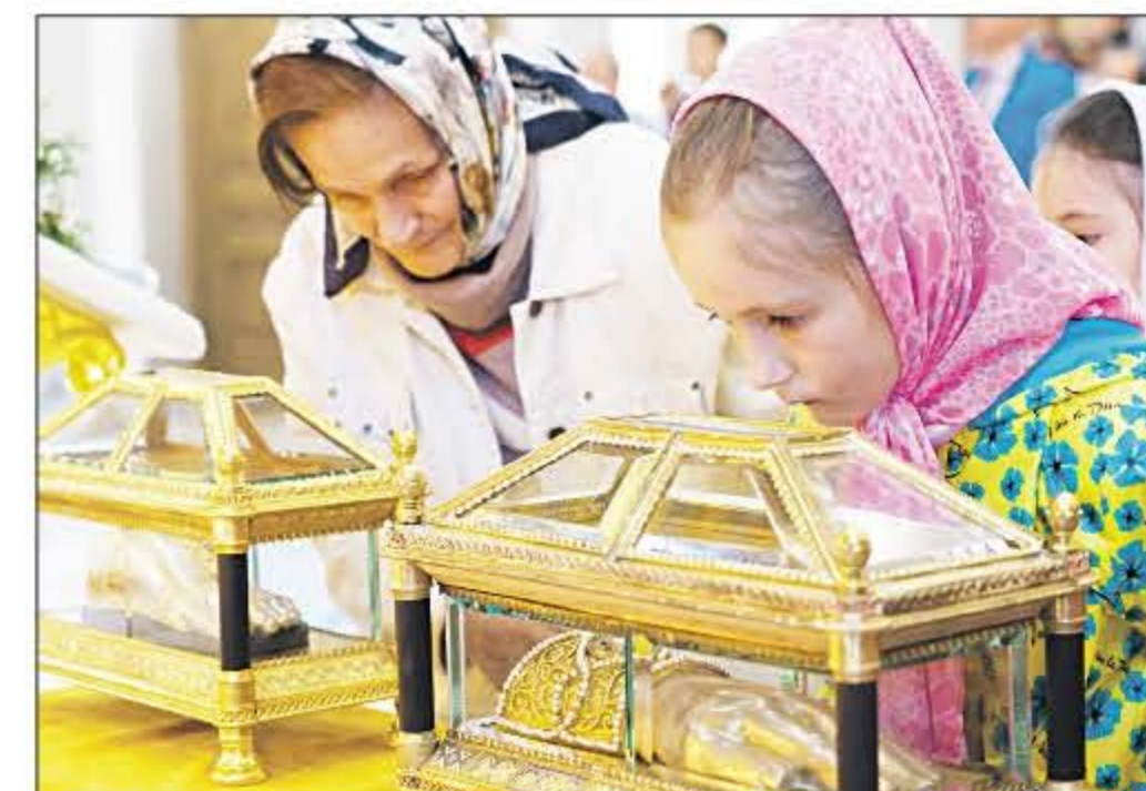
Помолиться у ковчегов с мощами праведной Анны и преподобного Романа Сладкопцева может каждый верующий.

Храм будет обновляться и дальше. Сейчас ему передали церковный дом. После реставрации там планируют открыть иконостасную школу и организовать детский хор.