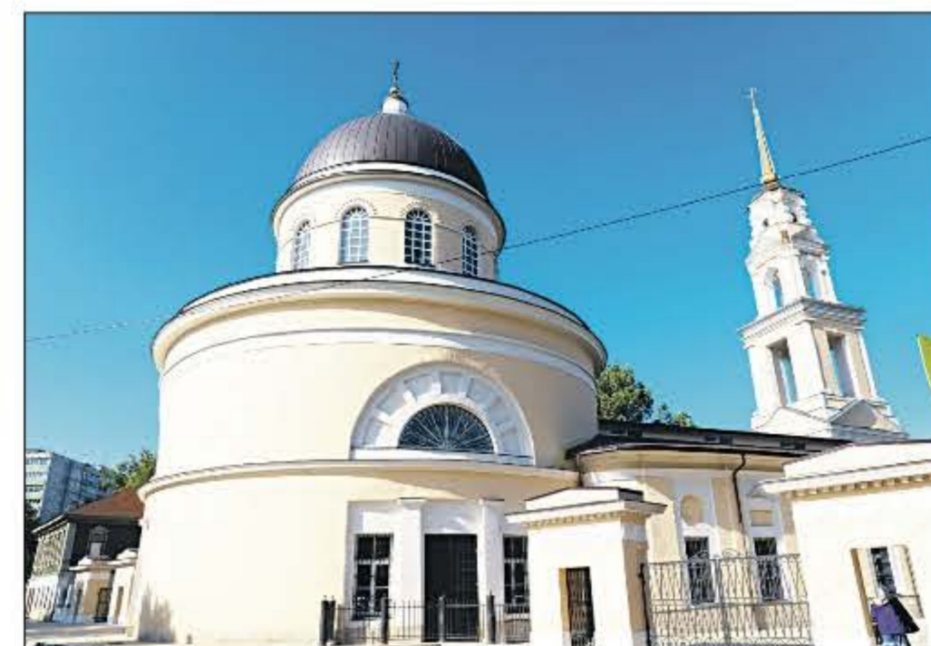
Храм Святых Петра и Павла на улице Ленина в Туле отреставрировали и вернули прихожанам.