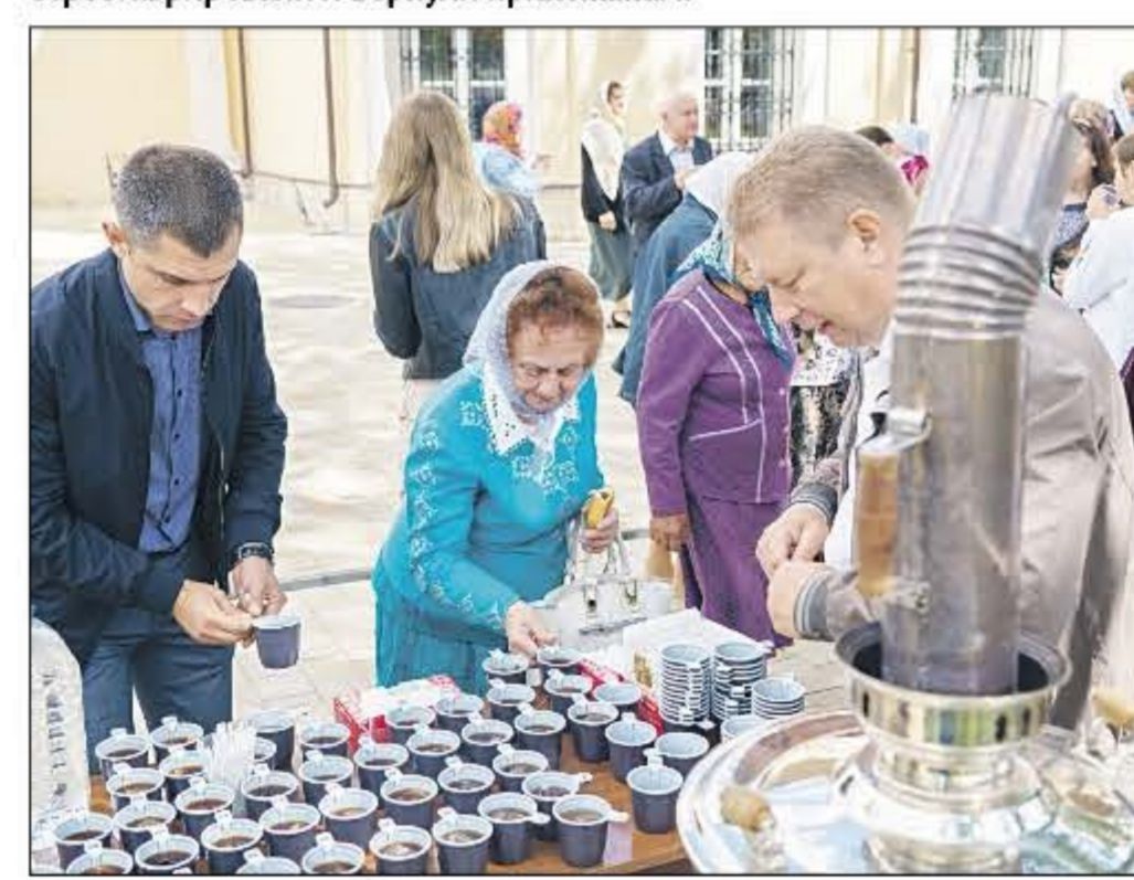
После праздничного богослужения всех прихожан угощали чаем из сорокалитрового самовара с пирогами и сладостями.

тять очень редко. С сегодняшнего дня они будут постоянно пребывать в нашем храме, их тоже передали нам в дар. Эти уникальные мощи станут большим подспорьем и духовным утешением для туляков и гостей нашего города. Я слышал, как сегодня благодарили владыку за теплую службу. Пел прекрасно наш мужской хор, многие прихожане тоже пели. Очень приятное ощущение осталось. Сегодня было много прихожан, кто-то пришел из других приходов — это уже традиция русского народа: в престольные праздники ходить в гости.