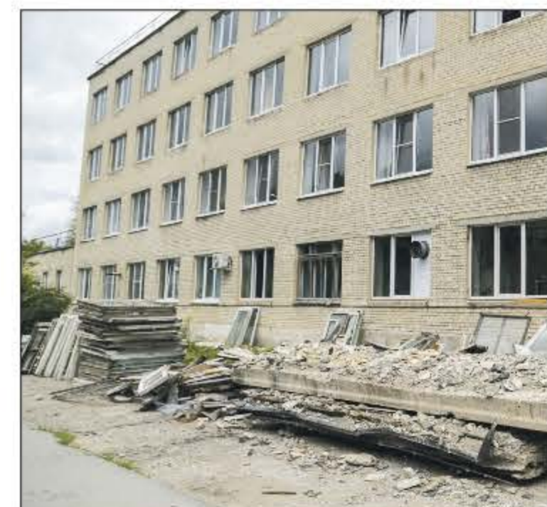
Больница в поселке Первомайский нуждается в ремонте.