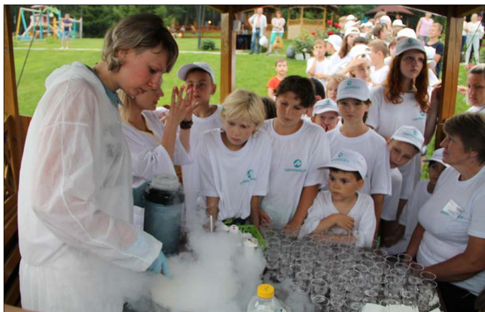
Крио-шоу: химические опыты вызвали у ребят неподдельный интерес.