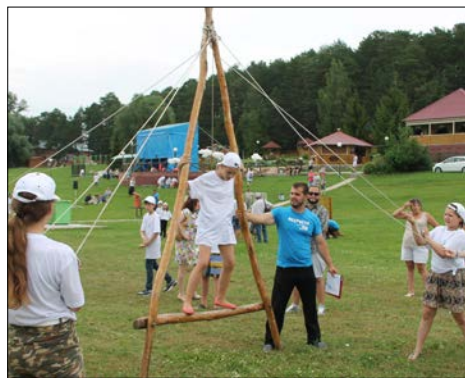
Держать баланс на рогатине-ходулях непросто.

Продолжился праздник веселым и занимательным химическим шоу. С помощью жидкого азота ребята готовили вкусное мороженое и попкорн. Веселья, скажу вам, было море.