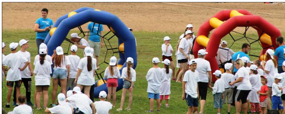
Соревнования в разгаре: гигантские колёса крутить нелегко.