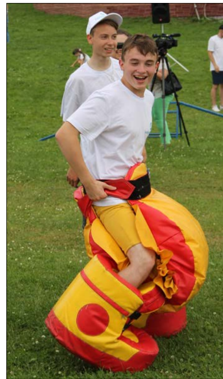
А ну-ка, догони!

День катился к ужину. За ним и дождь умолк. Уже в сумерках детвора уселась к сцене и слушала концерт. А потом были танцы – под зажигательные мелодии и красивые голоса тульских певцов. Но самое необыкновенное, по-настоящему феерическое зрелище ждало отдыхающих поздним вечером. Небо взорвалось ослепительным многоцветьем, переливающимися и меняющимися новыми узорами, как в гигантском калейдоскопе. Салют сопровождался восторженными возгласами и аплодисментами.