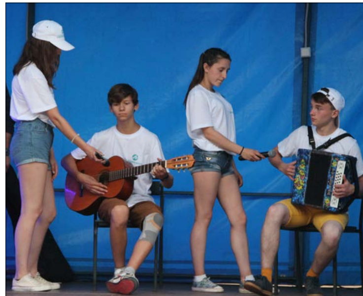
Юные таланты покорили своих поклонников.