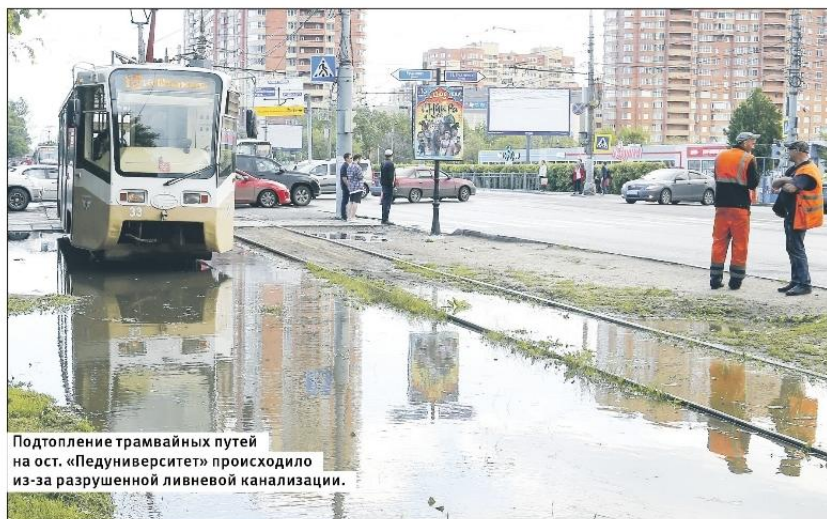
Подтопление трамвайных путей на ост. «Педуниверситет» произошло из-за разрушенной ливневой канализации.

Так, жители неоднократно жаловались на то, что после дождя перекресток улицы Лейтейзена и Красноармейского проспекта, а также вся площадь у остановки «Педуниверситет» заполняется водой. В последнем случае огромная лужа мешала не только пешеходам, но и движению трамваев. Было проведено инженерное исследование, и оказалось, что в данном случае проблема была не в засоренных решетках, а