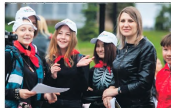
По инициативе компании «Щекиноазот» проходят фестивали юных художников и вернисажи.