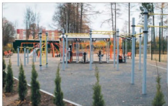
Зона спорта в парке – это и площадка для воркаута, и детская спортивная площадка, и поля для мини-футбола и баскетбола.