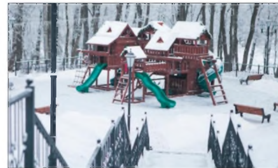
Детский городок в северо-западной части Платоновского леса появился в 2016 году. Он уникальный – такого нет нигде в центре России.

А к Рождеству в парке залили каток и установили детскую зимнюю горку. Финансирование работ по благоустройству и текущей эксплуатации Платоновского парка осуществляется за счет собственных средств компании. Посещение парка свободное и бесплатное. Для удобства посетителей парка и спадельных кортежей обустроена бесплатная автомобильная парковка.