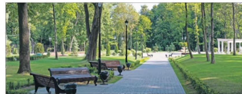
Пять лет назад на этом месте была непролазная чаща. Теперь это любимое место отдыха жителей большого микрорайона.