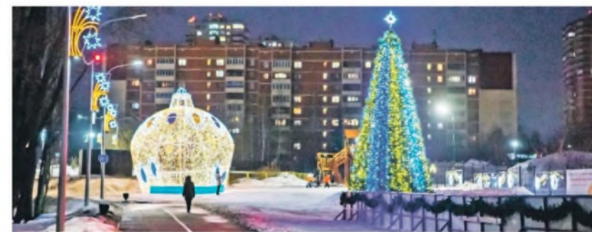
Новогоднее убранство парка, выполненное компанией «Щекиноазот», не уступает по красоте самым знаменитым столичным паркам и усадьбам.