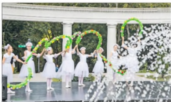
На главной площади парка у фонтана проходят концерты и фестивали. Это настоящий театр под открытым небом!