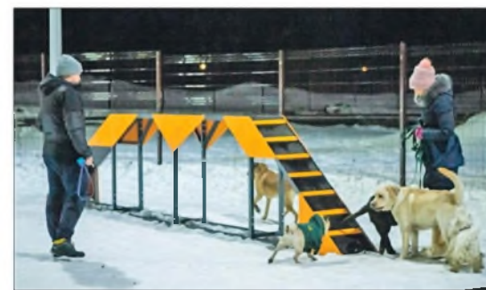
Стильную и удобную площадку для выгула и дрессировки собак в парке тоже построила компания «Щекиноазот» – по просьбам жителей.