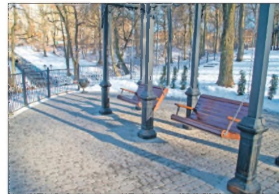
Уютные уголки парка. Подвесные качели – визитная карточка этого места.