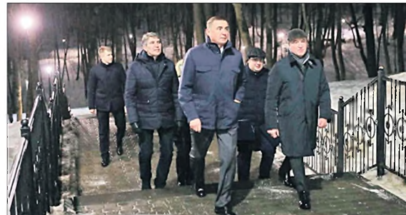
26 января 2021 г. Алексей Дюмин и Борис Сокол на осмотре Платоновского парка.

Зона культуры и отдыха расположена на западной стороне парка. Напротив бывшего ресторана «Купец Платонов» был обустроен главный вход в парк. В центре главной площадки парка установлен фонтан с окружающими его колоннадой в классическом стиле, цвето-