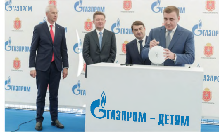
Старт строительства ФОКа с легкоатлетическим манежем на 2 500 мест.