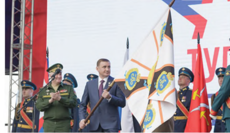
Торжественное открытие парка «Патриот - Тула».