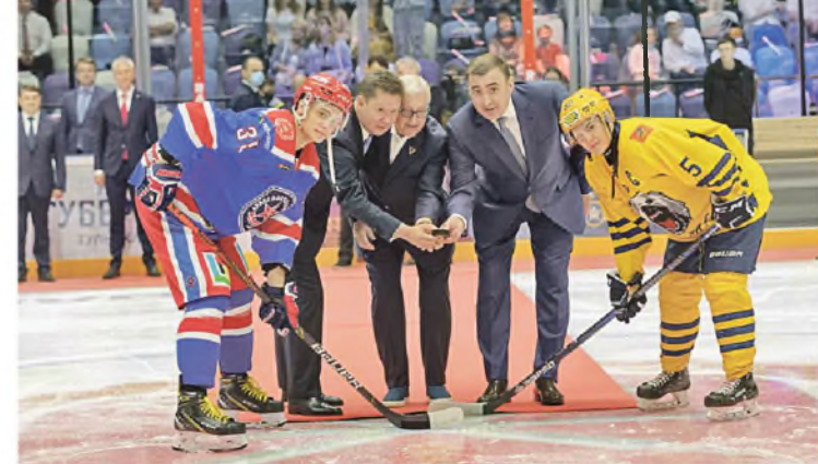
Открытие Ледового дворца в Туле.