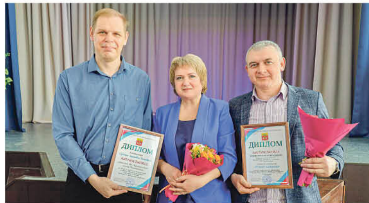
Представители трудовых династий и наставники с дипломами.